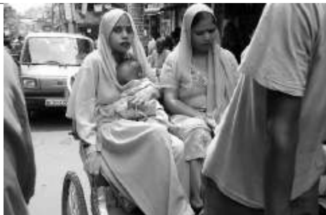
En las sociedades más próximas a lo tradicional, los bebés no crecen en guarderías, sino en los senos familiares