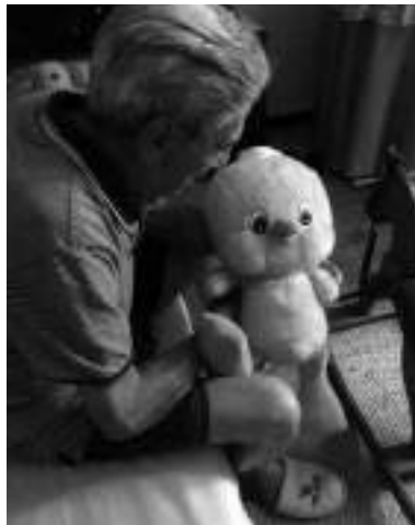
Los abuelos son cada vez más objeto de violencia dentro de la familia

Pero, a pesar de las características culturales y familiares de cada zona, el problema es global. Y no sólo sus hijos maltratan a los ancianos o los abandonan en geriátricos pésimos o “normales”, sino también yernos y nueras y hasta los nietos. Los ancianos son uno de los colectivos que más sufre la violencia en el hogar. Según algunos estudios, alrededor del 10% de las personas mayores podrían encon-