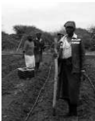
Los pequeños cultivos familiares, rodeados de bosque, permiten crear alimentos ecológicos y aumentar la biodiversidad...

Pero después de revisar casos de estudio de Costa Rica, El Salvador, Panamá, Argentina, Brasil y México, Perfecto y Vandermeer concluyeron que hay poco que sugiera que el modelo de transición forestal es útil para los trópicos y que éste proyecta una visión exageradamente optimista. En su lugar, los investigadores de la Universidad de Michigan proponen un modelo al-