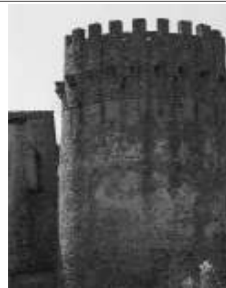
Las informaciones manejadas en la sociedad moderna sobre la Edad Media están muy manipuladas