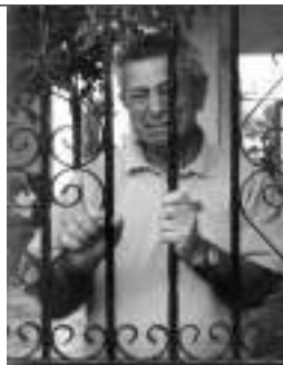
Muchos abuelos son abandonados en geriátricos a pesar de tener familia próxima

Otros abuelos viven una situación de estrés continuado en su propio hogar porque la desestructuración de la unidad familiar ha conllevado que se tengan que encargar ellos de sus nietos, cosa poco fácil cuando se han dado situaciones de estrés y de violencia en el hogar y que ellos viven, en no pocas ocasiones, como un aguje-