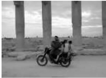
La unión familiar es una buena receta contra muchos problemas mentales de nuestra época

La Revista Cubana de Medicina Integral también asocia la disfuncionalidad familiar con trastornos depresivos y suicidas graves: "Se realizó un estudio descriptivo, prospectivo y transversal, en el