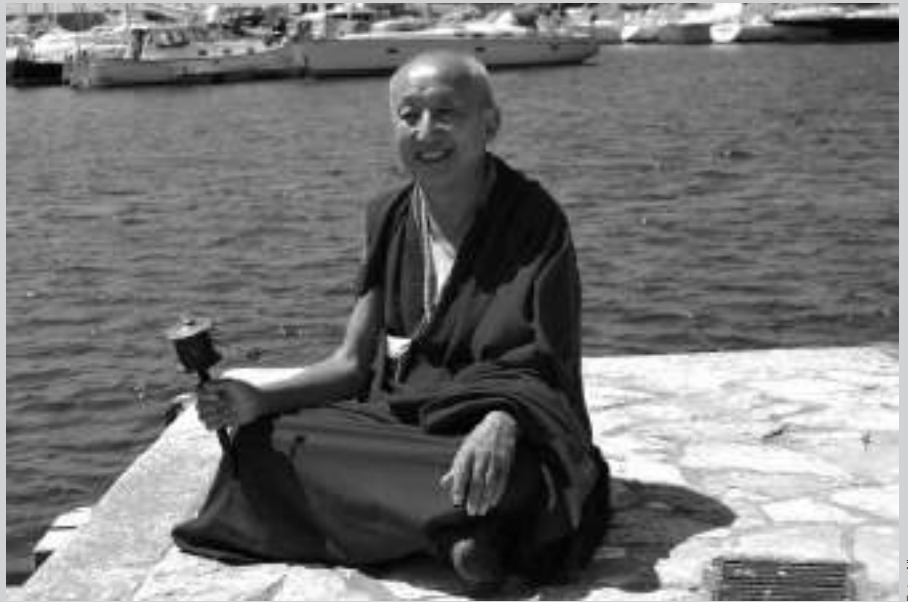
El sabio fotografiado en una zona del puerto de St Feliu de Guixols

-Hoy, en estos momentos de gran confusión espiritual, los que critican la sabiduría primordial, o los que no la conocen, señalan como actos negativos de gente que son budistas, musulmanes o cristianos, cuando, en rea-