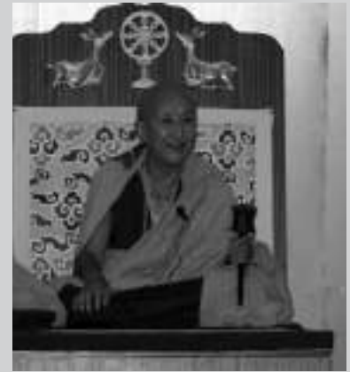
Un momento de las ceremonias budistas llevadas a cabo en St Feliu de Guixols

-En el Tibet antiguo, desconocido para la mayoría de nosotros, la vida del ser humano ¿fluía en perfecta naturalidad con el medio, con la sociedad, con la familia? ¿Cómo lo conseguían?