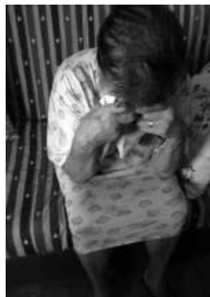
La soledad y la atomización familiar agravan los problemas de la pandemia de depresión global