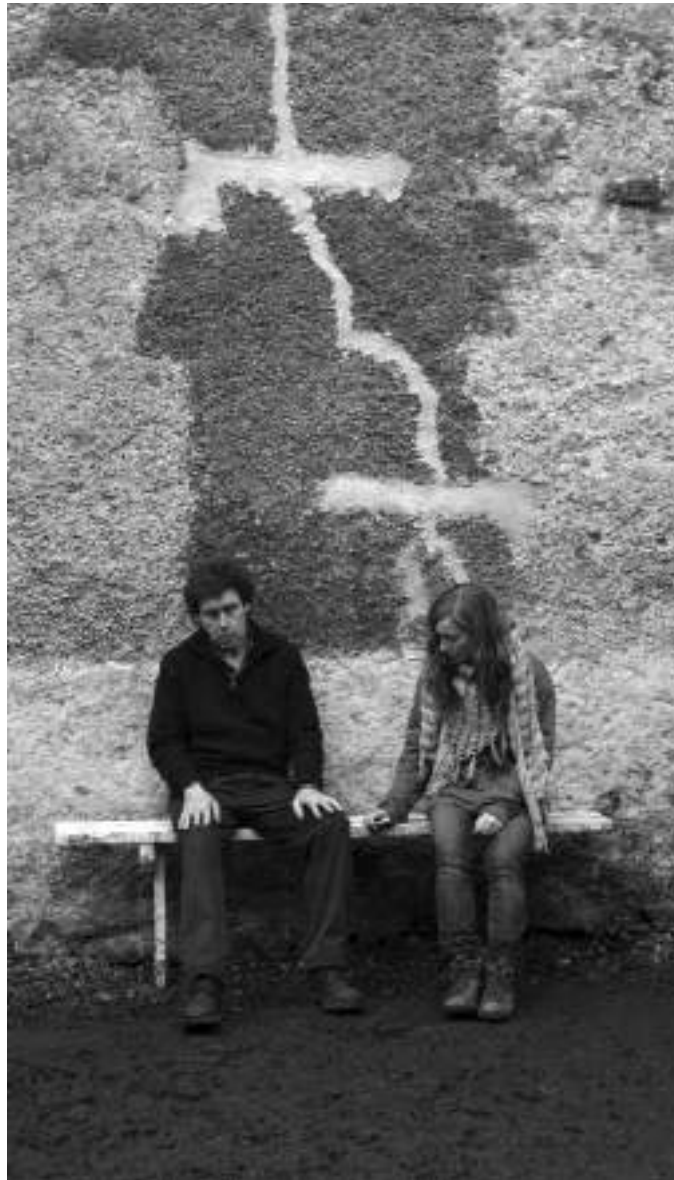
Incluso los núcleos sociales más pequeños están caracterizados por la inestabilidad en la sociedad moderna. ¿Qué hay detrás de eso? Los químicos tóxicos podrían ser un factor a tener en cuenta...

zonas del cerebro que tienen que ver con la excitación, las emociones, el juicio o la inhibición de impulsos”.